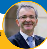
François BONNEAU Président de la Région Centre

La Région Centre est fière d'être partenaire et d'accueillir pour la première fois les "Ateliers du Développement Durable". Notre collectivité, après quatre ans d'application d'une "Charte du Développement Durable" à l'ensemble des politiques régionales, travaille aujourd'hui à la réalisation de son Agenda 21 qui verra le jour en juin 2008. L'Agenda 21 est l'occasion pour la Région Centre de renforcer, en plus grande transversalité, les principes du Développement Durable dans ses diverses politiques. Les chantiers que nous avons engagés pour mieux prendre en compte les aspects sociaux, économiques et environnementaux sont nombreux : Education, formation continue et développement de nouveaux métiers ; solidarité face aux besoins en énergie ; urbanisme, déplacements et habitat social ; éco conditionnalité des aides économiques et achats responsables ; agriculture et biodiversité mais aussi observatoires de l'énergie et du patrimoine naturel, évaluation de nos politiques publiques. Toutes ces questions nous préoccupent et seront au coeur des débats de ces Ateliers. Très bons échanges au bénéfice du Développement Durable et bon séjour en région Centre !