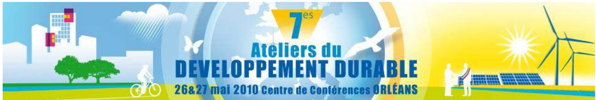
Schéma régional de cohérence écologique