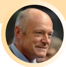
Alain ROUSSET Député de la Gironde Président du Conseil régional d'Aquitaine

La crise économique et les catastrophes naturelles à répétition obligent les décideurs publics que nous sommes à réinventer nos politiques. Il s'agit aujourd'hui de promouvoir un nouveau système de production, de consommation, de financement de l'économie, de déplacement, et de valeurs qui intègre pleinement le coût environnemental de nos décisions et de nos actions. Nous pouvons tirer parti des politiques de relance pour accélérer les mutations économiques et sociales que nous avons engagées depuis une dizaine d'années afin de prendre résolument le virage de la croissance verte en s'attachant à la fois à ses dimensions économiques, sociales, environnementales et de gouvernance. Ces 6 es Ateliers du développement durable doivent nous aider à conforter cette option en nous proposant les réflexions et solutions qui nous permettront de voir toujours plus loin. Plus que jamais le temps est à l'action.