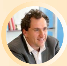
Vincent FELTESSE Président de la Communauté Urbaine de Bordeaux Maire de Blanquefort

La vaste question du “développement durable” suscite des prises de positions nombreuses parfois idéologiques et conflictuelles, des publications contradictoires, voire de simples stratégies de communication, qui brouillent les enjeux et notre capacité à y répondre.